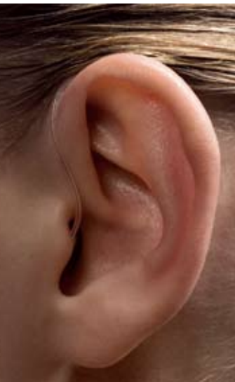
Bak við eyra (BTE)

Á síðustu tíu árum hafa tækin þróast á sama hátt og tölvur og farsímar. Nú eru þau lítil, næstum ósýnileg og þau vinna margfalt betur en gömlu tækin. Nokkrar gerðir eru af heyrnartækjum: Bak við eyra (BTE), inn í eyra (ITE), inn í hlust (ITC), algjörlega inn í hlust (CIC) og innfæld opin tenging (IOT).